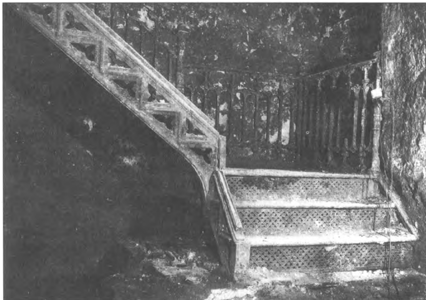
Усыпальница Демидовых. Фрагмент лестницы в склеп. Чугун, литые.

Изучению погребений предшествовала очистка склепа, в ходе которой найдена масса разнородных предметов различного времени, в том числе две части чугунной формы (вероятно, для литья ядер), фрагменты окладов икон, чугунные ступка и пестик с оловянной ручкой, обломки чугунного ограждения ведущей в склеп лестницы, ручки от гробов, пластинки слюды и т. д. После очистки обнаружилось, что пол усыпальницы покрыт металлическими плитами размером 2,0 \times 1,5 метра (полностью сохранились две плиты), лежащими на блоках белого камня, уложенных на песчаную подстилку. В центральной и северо-западной частях склепа в перекопе найдены многочисленные фрагменты печных полихромных рельефных изразцов конца XVII — XVIII веков.