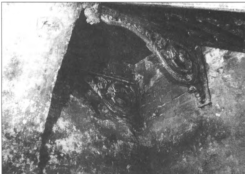
Усыпальница Демидовых. Фрагмент кронштейнов верхней площадки лестницы в склеп. Чугун, литье.

По особенностям кладки ящика мужское погребение 2 — более раннее. Сохранились остатки одежды (штанов) и кожаные башмаки. Обнаружены пуговицы и крест из белого металла с цветными эмалью, перстень с камнями 11 , фрагмент ткани с бисерной вышивкой. Прослеживаются следы узкого парчового (?) пояса, прибитого маленькими гвоздями к днищу гроба и перевивавшего погребенного. В женском погребении 1 сохранились остатки одежды и обуви: красного платья, расшитого серебром, туфель, расшитых золотистой нитью. Обнаружены украшения и нательный крест. Между гробами погребений 1 и 2 найдена монета 1735 года.