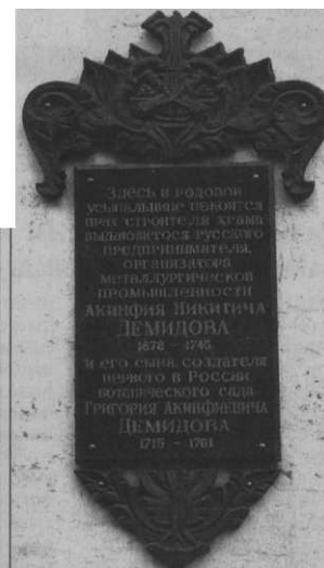
Внутрихромовая усыпальница нуждается в реставрации.