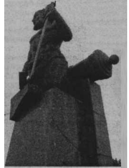
Постамент памятника Н. Демидову дал трещину