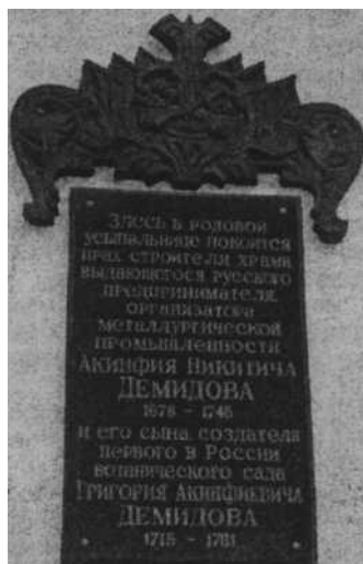
Памятная доска на фамильной усыпальнице.

На месте кладбища, ставшего последним приютом для большинства казенных кузнецов, живших в Оружейной слободе, установлен памятный знак в виде креста. Кладбище это действовало до начала 1770-х годов.