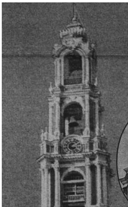
Сравните завершения тульского храма (справа) и колокольни Троице-Сергиевой лавры.