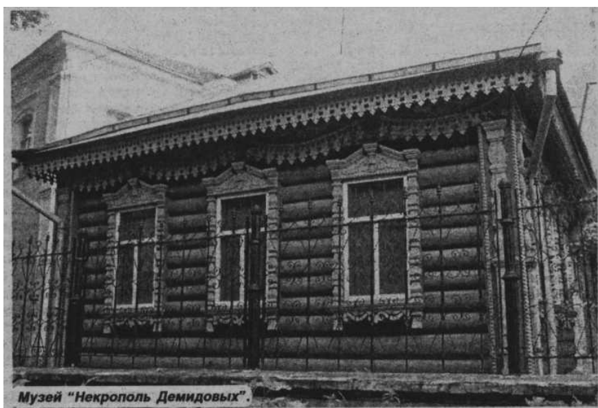
Наталья КИРИЛЕНКО.