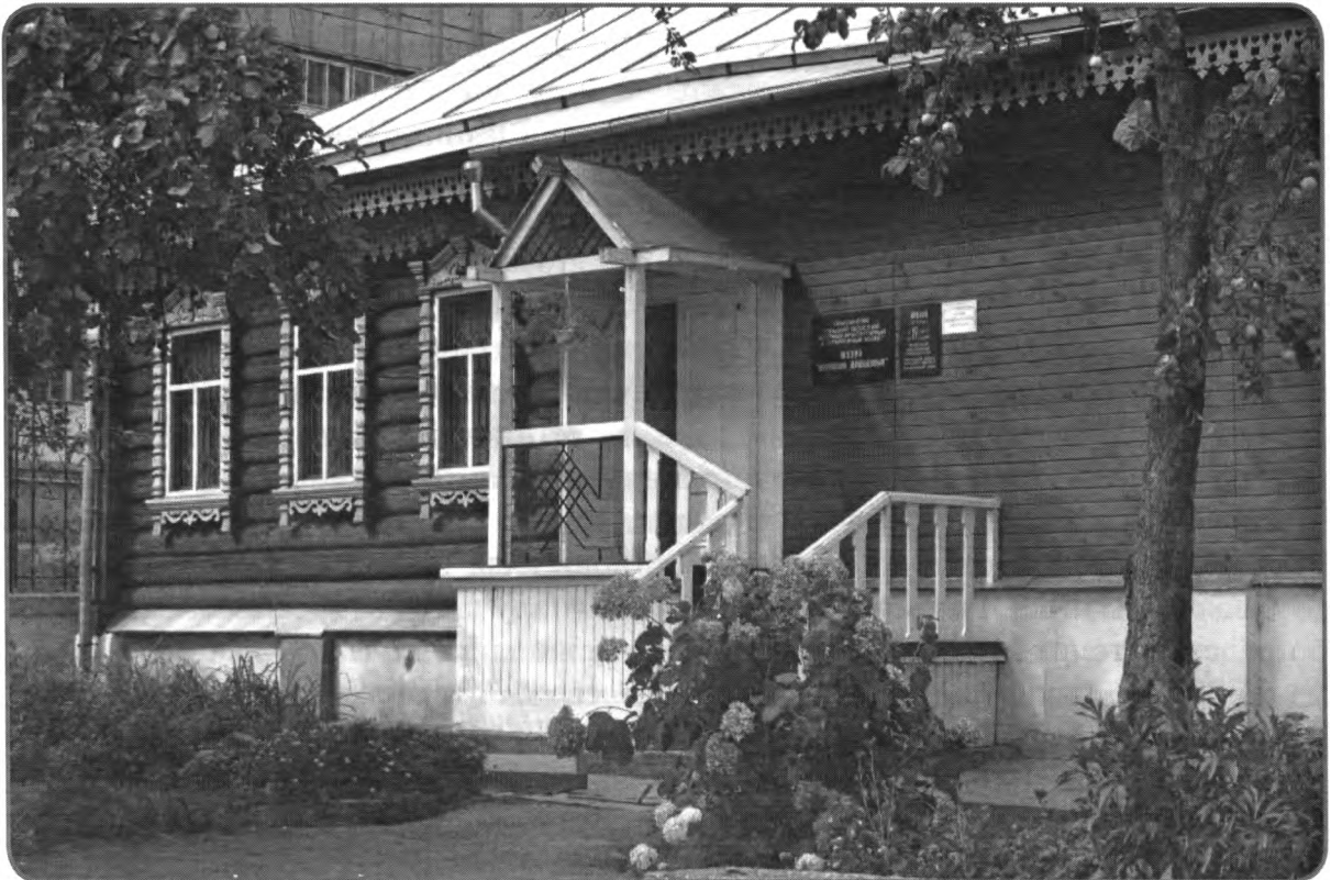
Здание Историко-мемориального музея Демидовых

Масштаб разносторонней деятельности представителей династии Демидовых как в России, так и в Европе позволяет музею вести активную музейно-выставочную работу и сотрудничать со многими музеями, библиотеками, сообществами, краеведами.