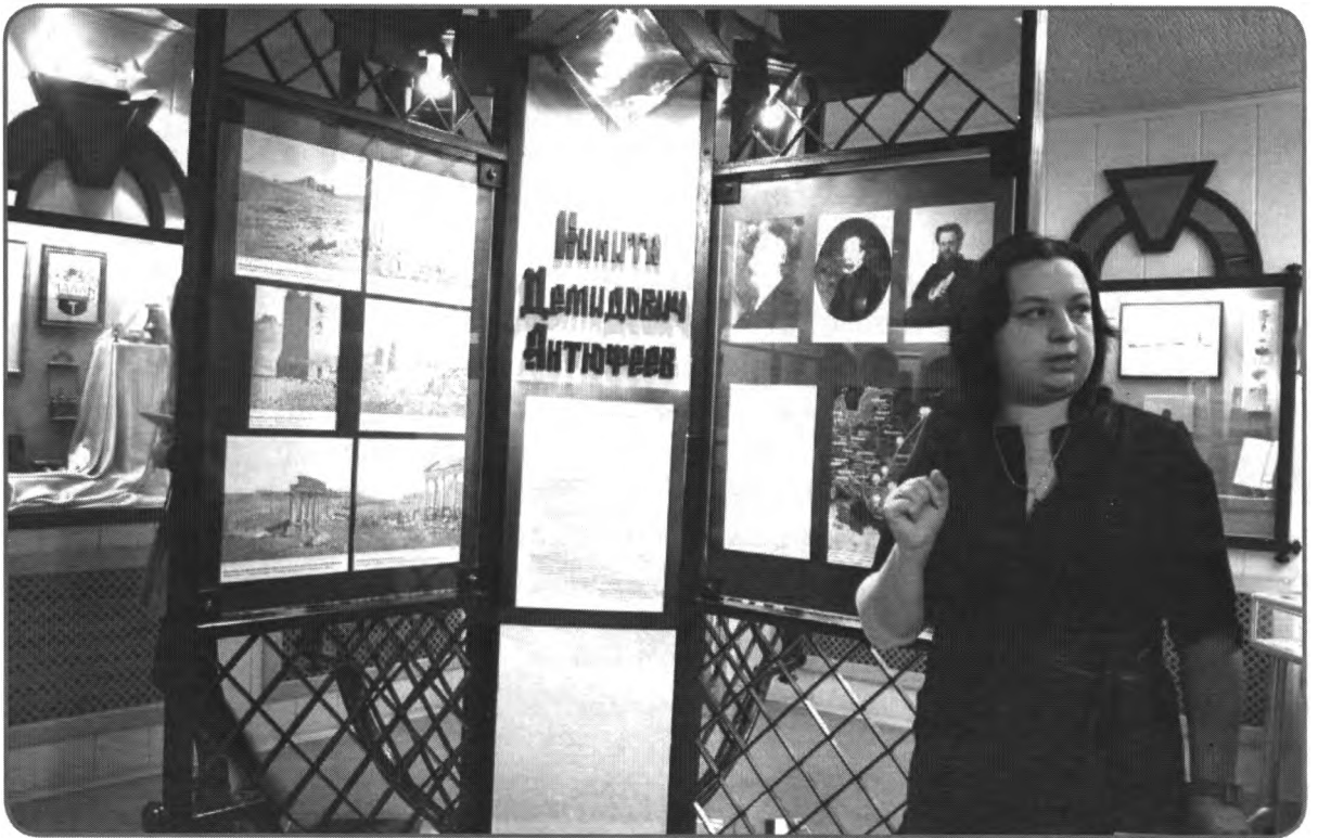
Открытие выставки «Путь на Восток. Пальмира — невеста пустыни». 28 января 2016 г.

ны письма П. И. Чайковского, выписки про Ясную Поляну. Данное издание было приобретено музеем и также займет свое место в экспозиции.