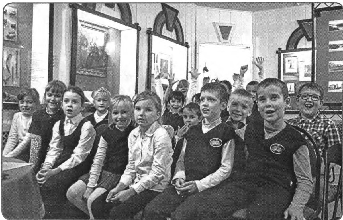
Интерактивные занятия для детей

Как рассказать детям о Демидовых? Как обойти такие сложные для них понятия как предпринимательство, индустрия, промышленность, строительство заводов, государственные заказы и т. д.? С такой проблемой столкнулись сотрудники музея при открытии постоянной экспозиции. Но все понимали, что детская аудитория должна быть охвачена и необходимо разработать стратегию по привлечению детей в музей. И не просто привлечь, а завлечь и сделать так, чтобы они пришли еще. В музее была подготовлена культурно-образовательная программа «Музей и дети», включающая в себя несколько музейно-педагогических занятий, с помощью которых наиболее эффективно