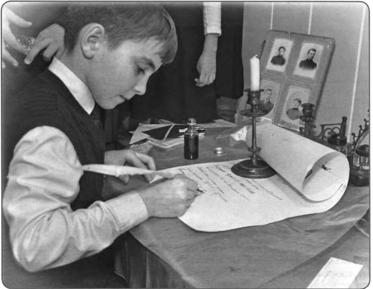
Интерактивное занятие «В гостях у тульского гимназиста»