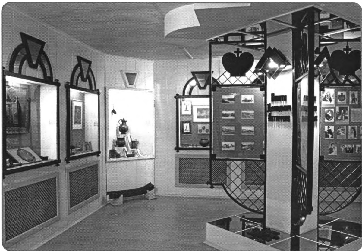
Экспозиционный зал музея