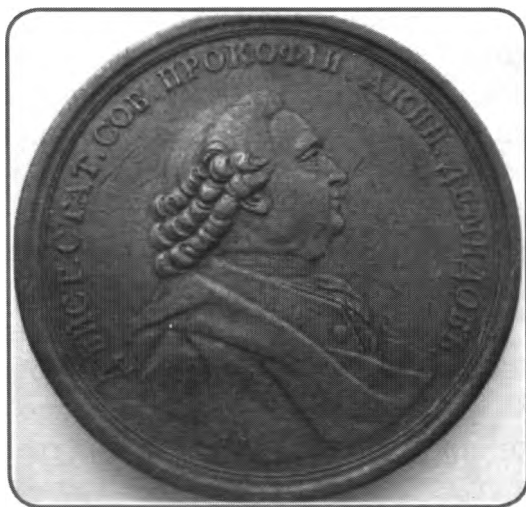
Медаль в честь Прокофия Акинфиевича Демидова

К 300-летию со дня рождения Григория Демидова и 305-летию со дня рождения Прокофия Демидова 25 ноября 2015 г. в музее открылась выставка «Жизнь в цвете и цветах», на которой состоялась презентация нового экспоната, приобретенного усилиями музея, — это медаль 1772 г. в честь Прокофия Акинфиевича Демидова «На открытие Коммерческого училища при воспитательном Доме в Москве». На аверсе медали изображен погрудный портрет П. А. Демидова, обращенный вправо, и надпись: «Действ. Стат. Сов. Прокофий Акинф. Демидов».