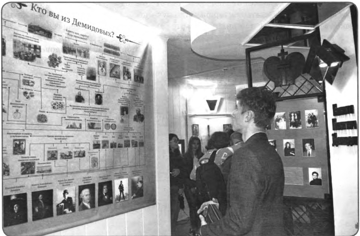
Музейный тест «Кто вы из Демидовых?»

Современной детской аудитории недостаточно просто слушать лектора и созерцать предметный ряд. Ребята хотят активно участвовать в процессе познания, двигаться, играть. Для такой аудитории разработаны лекции-выставки с интерактивными элементами – прямое вовлечение публики в действие. Главная идея – развлекаая, заинтересовывать и просвещать, пробуждать творческую активность.