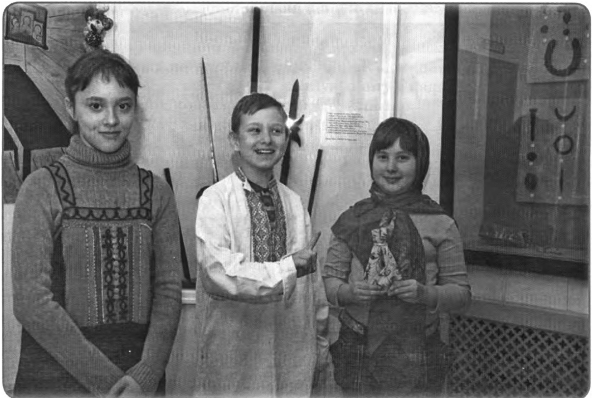
Масленица в Оружейной слободе